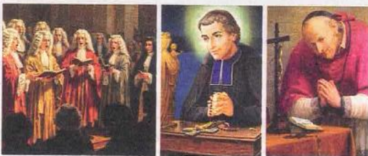
Costretto al silenzio dalla polifonia barocca, il popolo risponde coltivando il canto devozionale. Tra gli autori più prolifici: san Luigi Maria Grignon de Montfort (al centro) e sant'Alfonso Maria de' Liguori (a destra).