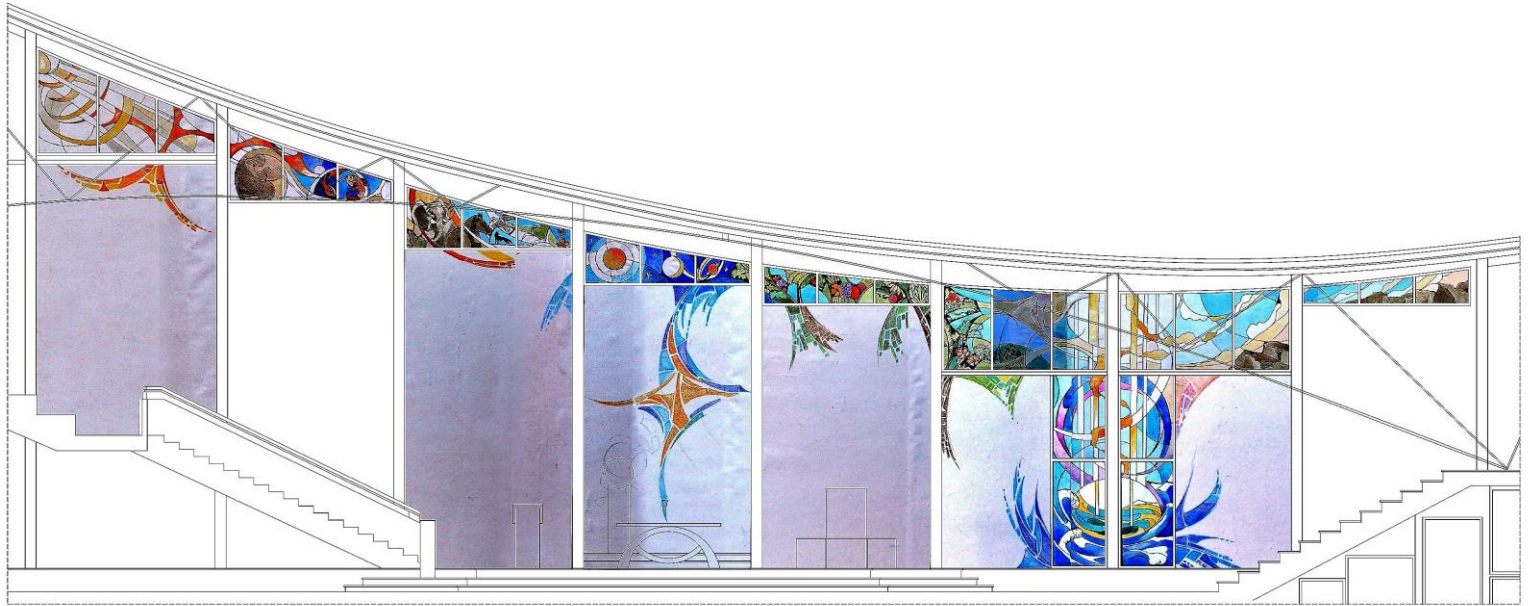
sezione AA - scala 1:50